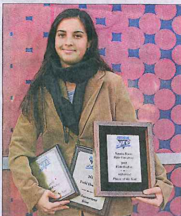
Con sus distinciones de 2012, su mejor año